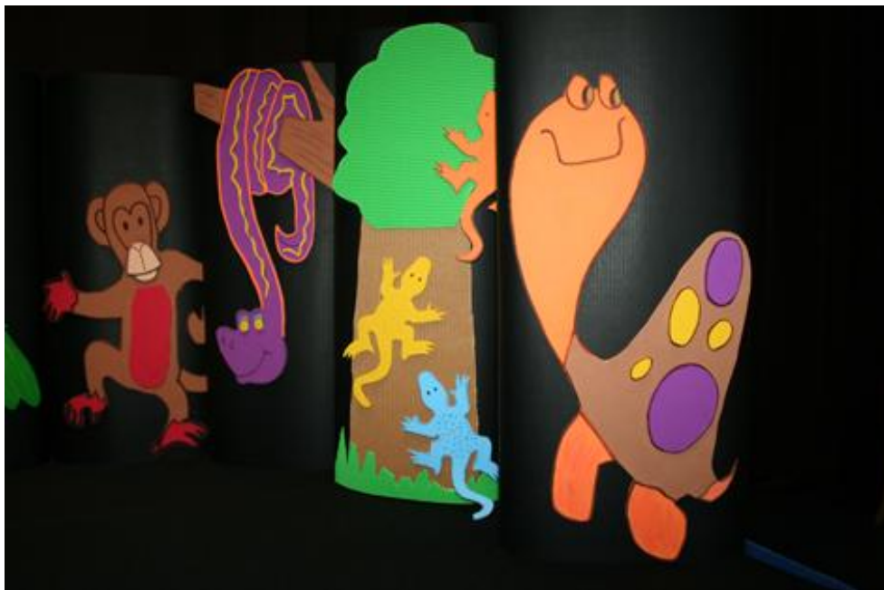
Tortuguita Antonia, el mono Sansón, la Vieja Serpiente y las Lagartijas

Antonia es una tortuguita que nace después de sus 200 o 300 hermanitos/as, todos han salido del cascarón y se han ido en busca del agua cálida del mar. Antonia, por el contrario ha extraviado el camino y se dirige hacia la selva. Allí se encontrará sola y triste, hasta que Sansón un divertido mono, le ayuda, y creyendo que ella solo quiere beber un poco de agua, la conduce hacia la Laguna Oculta, un pantano infestado de cocodrilos. Pese a las advertencias de Sansón, Antonia hace caso omiso y se tira al agua, Sansón sale corriendo para avisar a su madre del peligro que corre su nueva amiga. Cuando llegan los loros y demás habitantes de la selva, intentan avisar a Antonia del peligro que corre, pero ella supone que le están saludando, pues está tan lejos que no les escucha. Cuando cocodrilo ya está casi al lado de Antonia, todos los animales, cada uno a su manera, muestra su valentía y arrojo al arriesgar su propia vida por salvar la de Antonia. Cuando están contando al gran oso sabio todo lo ocurrido, escuchan un ruido y recuerdan que no vino con ellos la Sra. serpiente. Todos, con precaución detrás del oso, corren hacia Laguna Oculta. El oso espanta a los cocodrilos y todos quedan más tranquilos. Antonia con los días piensa que debe buscar a su familia y sus amigos la conducen hacia el mar. Duda mucho antes de entrar en él, pero finalmente se deja rodear de la espuma cálida de las olas, que la llevan para siempre hacia su hogar.